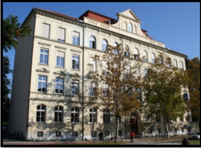
Slika 3: III. gimnazija Maribor