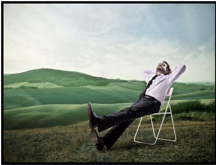
Slika 1: Slika na temo prosti čas

To je čas, kadar posameznik lahko počne to kar sam želi in ga veseli. V tem času nima nobenih skrbi in ne opravlja nobenega večjega dela, razen če ga to veseli.