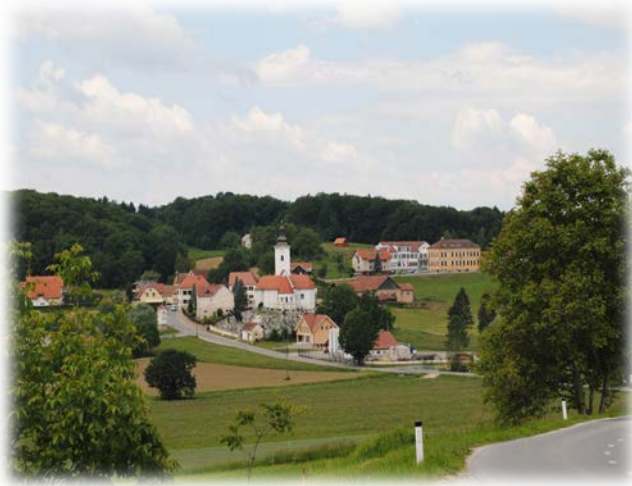
Slika 7: Jurovski Dol

Slomšku in cerkev Sv. Jurija v središču naselja. Tukaj se vedno nekaj dogaja. Ohranjamo veliko starih šeg oz. navad in imamo tudi veliko različnih društev kot so na primer: kulturno društvo Ivan Cankar Jurovski Dol, društvo kmečkih gospodinj, športno društvo, gasilsko društvo, društvo čebelarjev in podobno. Zelo zanimiv praznik v našem kraju je tudi Jurijeva nedelja 7 . To je praznik, ki odvija ob koncu aprila. Takrat se v kraju zbere zelo veliko ljudi in tam poteka blagoslov konjev, postavijo se veliki šotori ter stojnice, nastopa naša folklorna skupina Jurovčan in podobno.