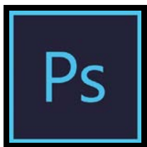
Slika 4: Logotip Adobe Photoshopa