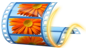
Slika 5: Logotip Windows Movie Makerja